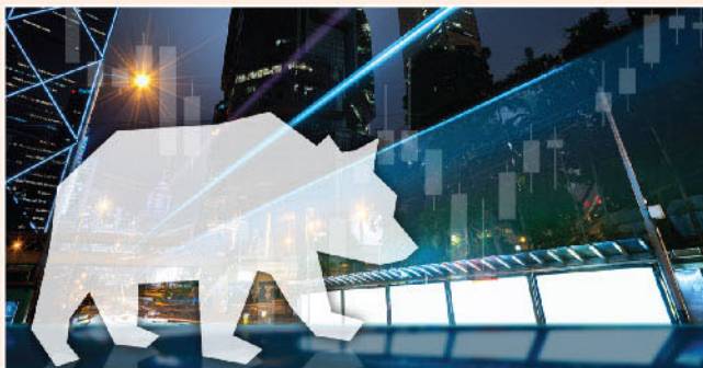
▲ 港股步入技術性熊市，投資者不宜胡亂估底。(筆者並未持有相關股份)

截止執筆一刻計(9月20日中午)，恒指曾低見23871點，而自今年2月18日高位31183點之調整，調整幅度亦達23.4%，亦即是說，指數已從高位調整多過20%(<24946點)，從傳統角度上看，已步入技術性熊市。而步入技術性熊市後，投資者不宜胡亂估底。目前情況如年頭的科技指數一樣，一日恒指未重上24946點之前，後市亦難抱較樂觀之態度，能否繼續「炒股不炒市」亦是未知之數。簡單一點說，最壞情況則是弱勢繼續試低位，而強勢股份則出現獲利回吐之沽壓。