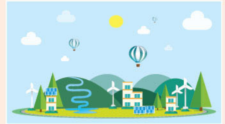
▲ 內地對環保議題的日益關注，有利相關行業的發展。

由於業績理想加上估值不高，績後見有資金追捧。筆者相信其估值仍有上調空間，股價若見調整不妨少注吸納作中線持有。