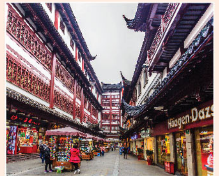
▲ 臨近季末機構調倉，料國內市場波動加劇。

9月以來，內地股市震蕩上行，上證綜指一度上試年內高位3731點，截稿時，兩市成交連續第43天保持萬億元以上，追平2015年歷史記錄，不過，上證50、滬深300、創業板指的走勢仍不樂觀。分析來看，內地出台政策穩定經濟、強調資本開放信號以提振市場信心，加上9月聯儲局預期鴿派，A股迎來8月之後一輪強勁反彈，不過，隨著8月經濟數據表現不及預期、內地疫情擾動、外圍市況波動、政策降溫炒作、內房債務擔憂等風險因素增多，市場避險情緒升溫，板塊輪動加快，高位股波動加劇。