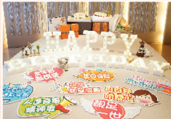
▲ 同事們為生日會悉心制作了各種精美裝飾及拍照道具，為生日會增添氣氛。