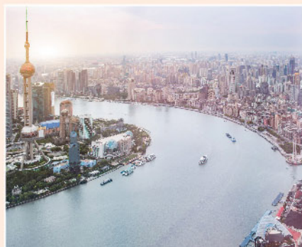
▲ 市場對內地監管憂慮已大幅降溫。

港股於整個第三季出現較明顯之回調，走勢上更一度令人擔心將會成為一個熊市，主要乃三大原因：1)內地監管風險(包括科技壟斷、教育澳門博彩及本地地產等)；2)內房債務違約風險；3)滯脹風險(能源危機，限電限產之憂慮)。但截止執筆一刻，市場已經開始對內地監管憂慮大幅降溫，科技股、教育股亦見有利好因素出現。而國務院副總理劉鶴表示言論稱房地產市場風險整體可控，在容納發新債的消息帶動下，個別內房亦見出現反彈，令整個投資市場氣氛進一步轉好。於第四季的下半場，只