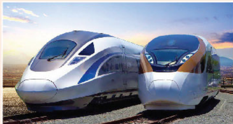
▲ 中車業績表現未見突出，IGBT的實質貢獻仍有待觀察。

近期不少股份股價波動，中車時代電氣(03898)便是其中之一。該股於6月時一度被熱炒，其一是回A因素，其次則是看好其IGBT發展。IGBT其實是電控系統中用於精準調控的開關，用於調節電路中的電壓、電流、頻率等，應用範疇相當廣泛，例如鐵路動車組，以至新能源車、智慧電網、光伏等行業。當中