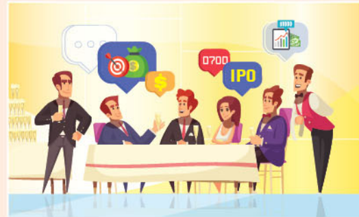
▲ Peter Lynch 的雞尾酒會理論可用作比較現時大市的情況。

金管理工作時，大家不感興趣，甚至寧願跟牙醫討論牙齒保健問題也不理睬Lynch；到第二階段時，大家會有興趣了解多一點投資市場，但仍不會太在意股份表現。