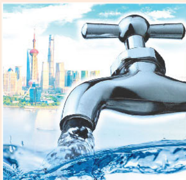
▲ 北水勢成港股主要動力，下一個目標將會是32000點關口。

港股踏入2021年後便牛氣衝天，截至執筆一刻計，恒指幾乎是由頭升到尾，本月恒指低位該為1月4日低位27079點，而高位仍在尋找中，月內波幅將會高達3000點以上。市況突然進一步熾熱，主要原因是「北水猛灌」，今年開局以來每日維持100億以上流入額度，至1月下旬更漸趨