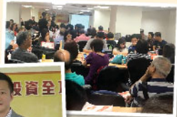
◀ 講座當日座無虛席，場面熱鬧

新股熱潮浪接浪，加上在互聯互通的制度下，帶動A股投資氣氛越趨熾熱，為滿足投資者的需求，耀才聯同華夏基金(香港)有限公司於5月12日合辦的《A股ETF × 港股IPO簡易投資全攻略》講座已順行舉行！是次講座反應熱烈，現場座無虛席，客戶更紛紛向演講嘉賓提問，為未來的投資部署做好準備。